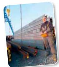
Das Bild zeigt Nico Schmidl am Portalkran im Außenlager